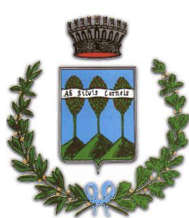
Comune di Cornedo Vic.no