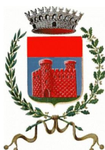
Comune di Brogliano