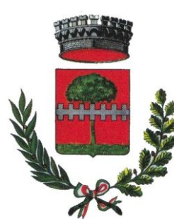
Comune di Nogarole Vic.no