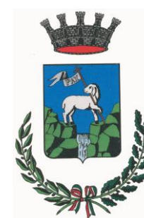
Comune di Valdagno