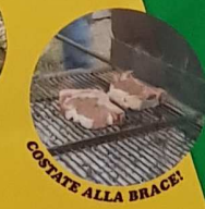
COSTATE ALLA BRACE!