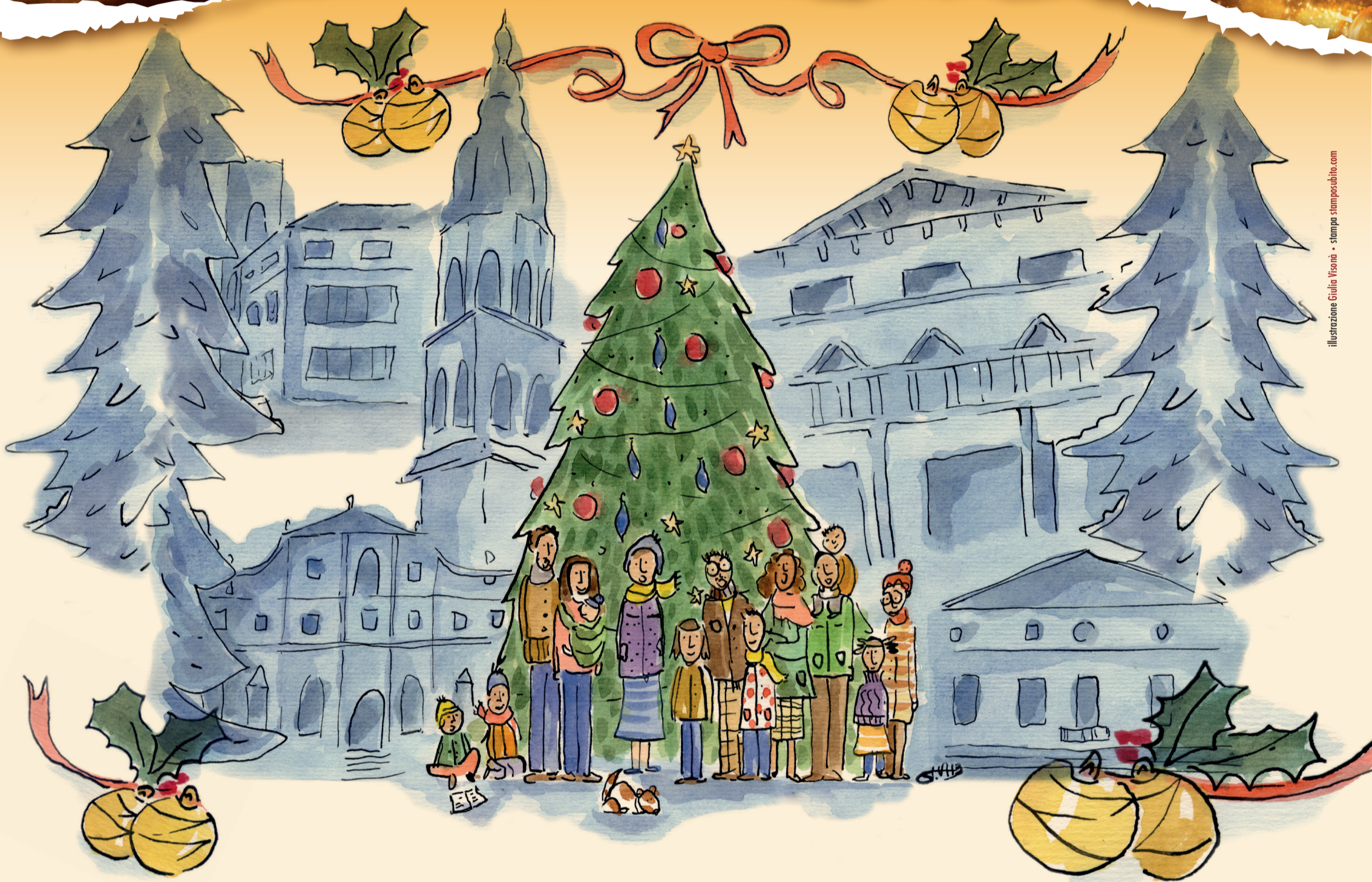
illustrazione Giulia Visoni - stampa stampobito.com

SABATO 3 DICEMBRE ORE 18.00, CENTRO STORICO Accensione dell'Albero in Piazza del Comune con la Musica dell'Orchestra Giovanile "Tutto d'un Fiato!"