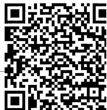
Segnala On Line Google Play