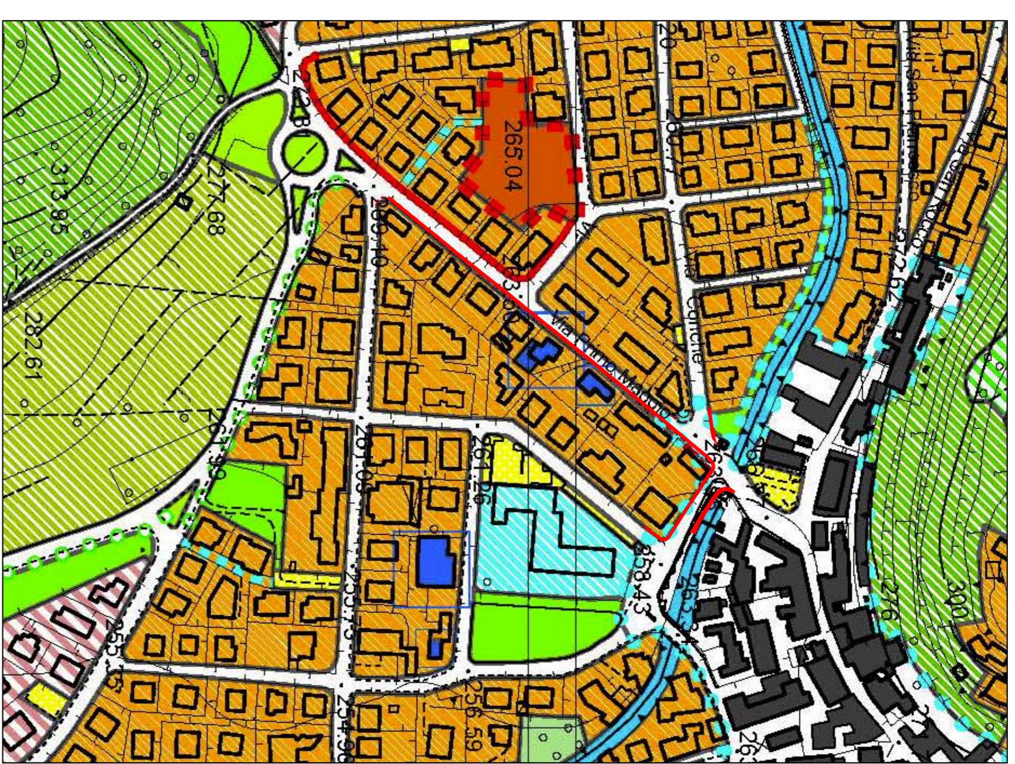
Estratto di P.R.G. - Via 1° Maggio Scala 1:2000