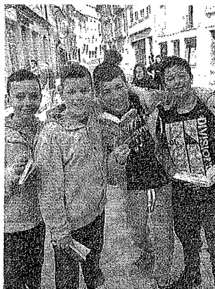
Giovani lettori in centro. K.Z.