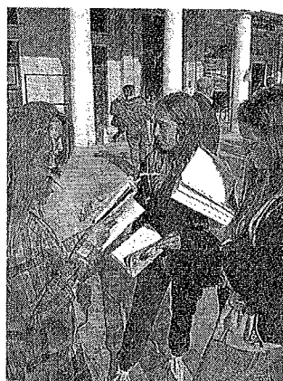
Letture di libri ad alta voce. K.Z.

aperte a Novale il lunedì, il giovedì e il venerdì dalle 20.30 alle 22.30 e a Ponte dei Nori, mercoledì e venerdì dalle 16.30 alle 19. ●